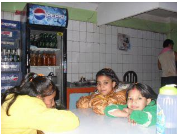
Efteråt gick de på restaurang.