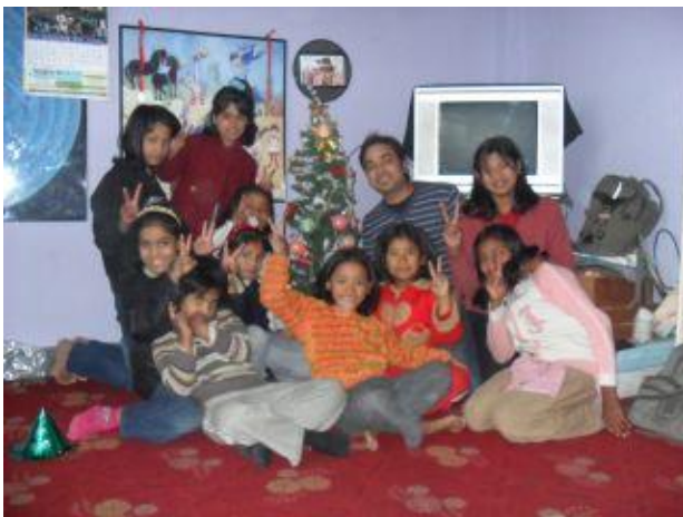
hjälp dem med granen.