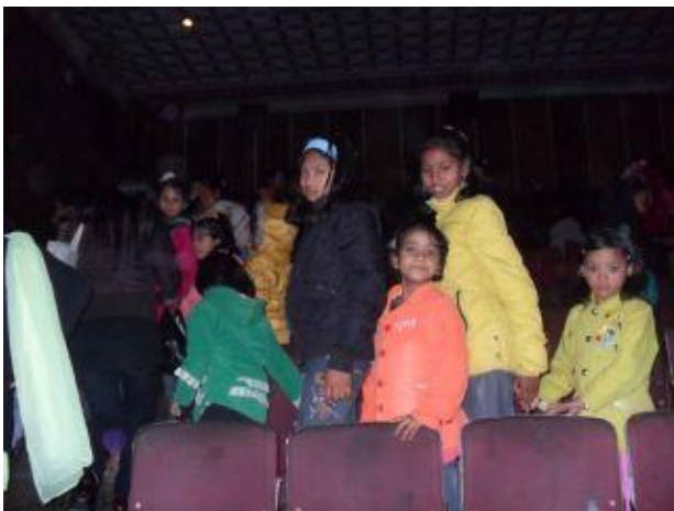
På väg ut från bion.

Barnen har varit på bio och sett en nepalesisk film. De brukar vara flera timmar långa, precis som indiska Bollywood-filmer och det tycker de mycket om.