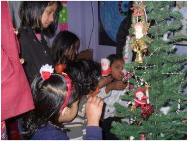
Alla hjälps åt med att klä granen.