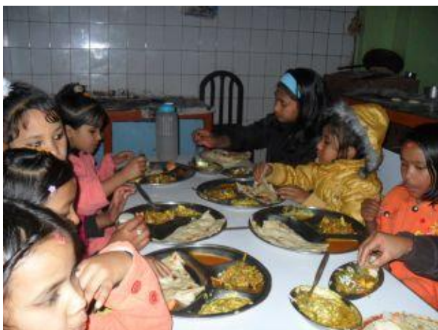
Traditionell nepalesisk mat.