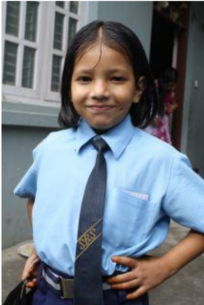
Smitri älskar att gå i skolan.