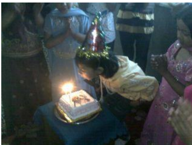
Tårta även denna födelsedag.