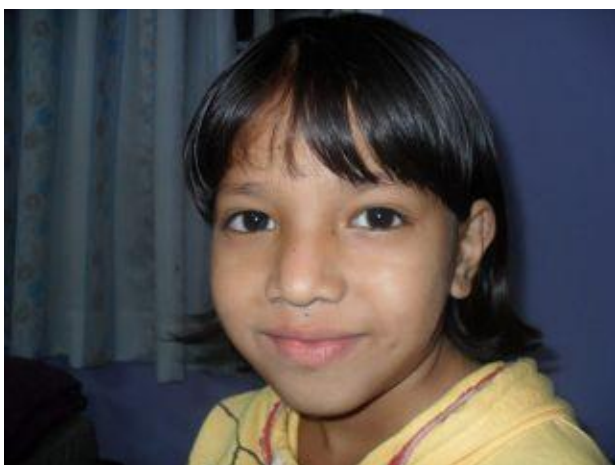
Ett alldeles nytaget foto.

En kväll i början av januari, besökte jag Sykretsen, Svenska Kyrkan i Bredaryd , och berättade om barnhemmet och visade bilder. Sykretsen är en värdefull bidragsgivare och det var verkligen roligt att vara där och träffa alla som stöttat oss ända sedan början.