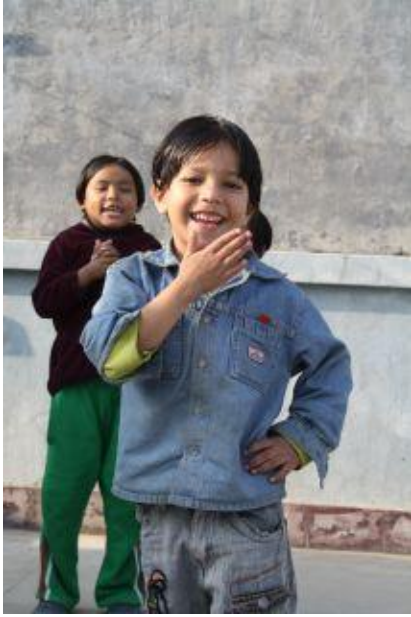
Sång- och dansuppvisning, hösten 2009.