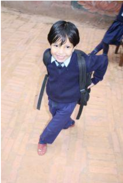
På väg till skolan, höst 2009.