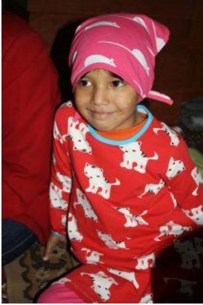
I nya kläder från Me & I, hösten 2009.