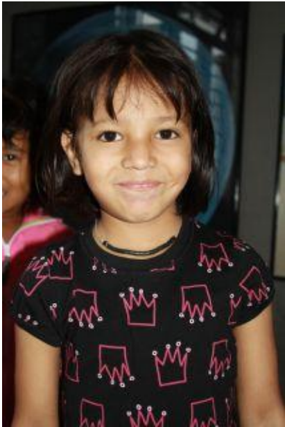
Smitri sommaren 2010.