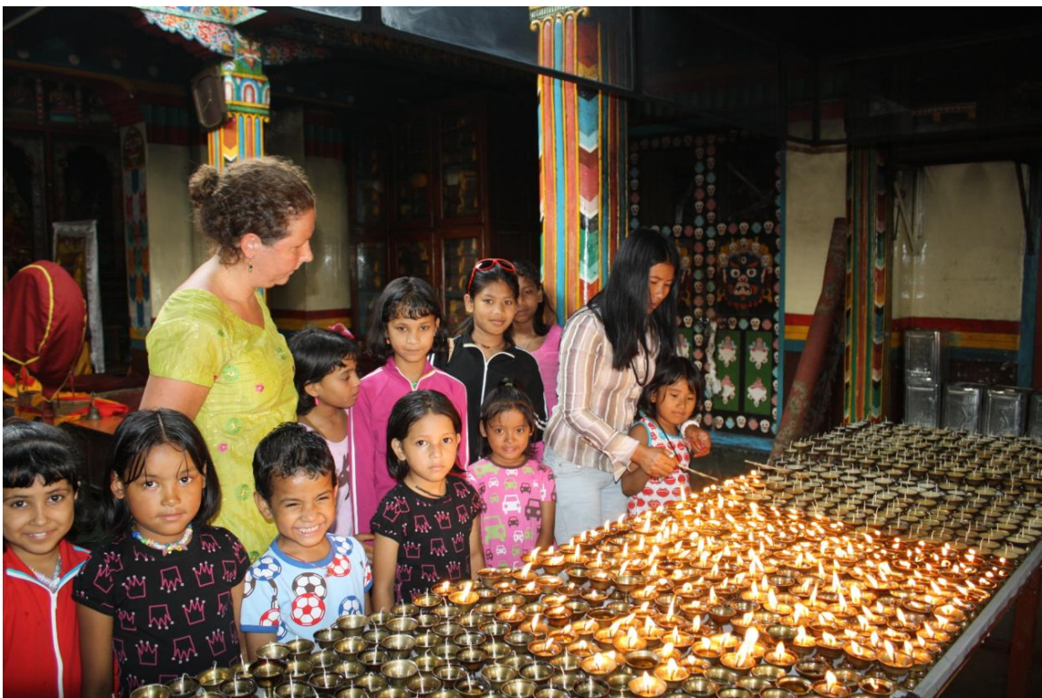
Vi tänder oljeljus inne i ett buddistiskt kloster

Vi var också på en heldagsutflykt till ett viktigt buddistiskt tempelområde i Kathmandudalen; Swyambudnath. Barnen var väldigt vördnadsfulla och var riktigt duktiga på alla olika ritualer man skulle göra vid olika ställen på området. Jag har varit vid detta tempel väldigt många gånger förut, men det var egentligen först nu som jag verkligen fick se vad man gör här. Det var en toppendag som avslutades med tibetanska momos på en pytteliten tibetansk restaurang i området.