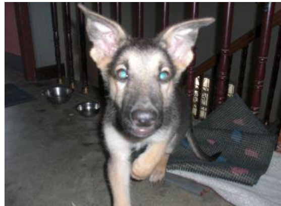
Neru och Amigo

Vi har fått fixa till köket efter att gasolspisen brann och vi har haft målare på plats som har målat om och ganska mycket ny köksutrustning har fått köpas in.