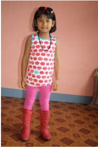
Guddu sommaren 2010