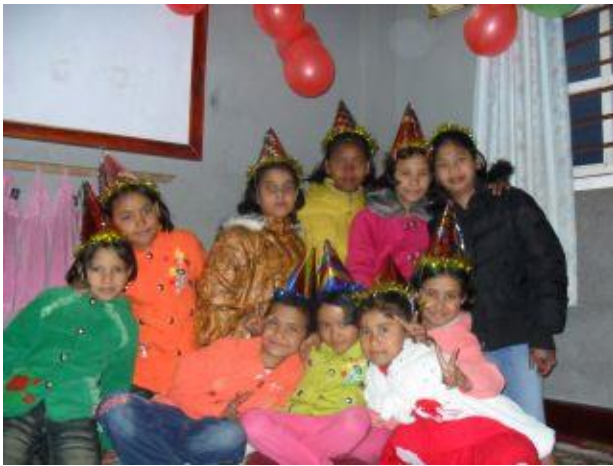
Guddus födelsedag 2010