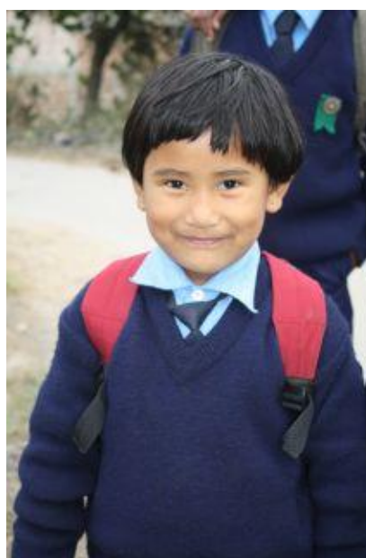
Guddu november 2009