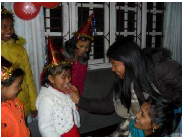
Neru matar sin dotter med