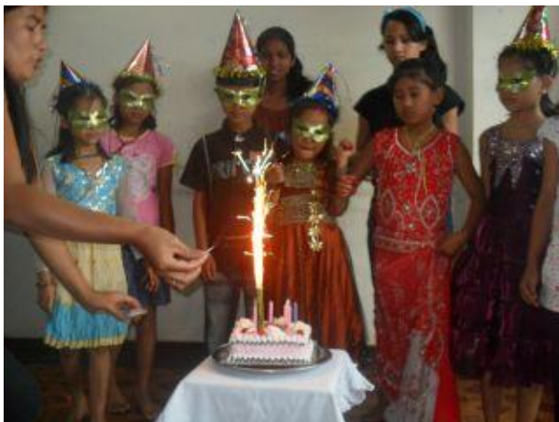
Dags för tårta!