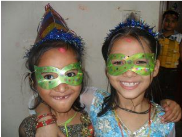
Shakira och kompisen Parmila.