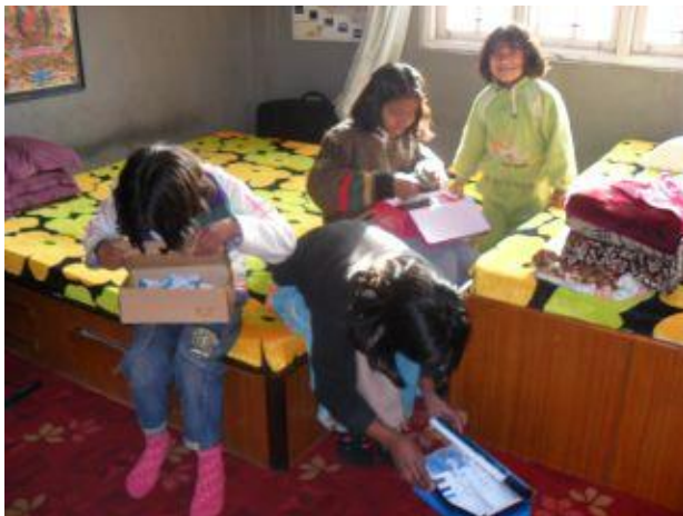
Barnen sitter på sina sängar i sovrummet och tittar på sina nya skor som fortfarande ligger i kartonger.

Under mars månad har barnen firat den stora högtiden Holi där man kastar röd färg och vatten på varandra. Det är en riktig folkfest; alla är ute på gatorna och kastar på varandra. Förra året tog Rajeev bilder på när barnen låg uppe på terrassen och kastade färg och vatten på förbipasserande på gatan nedanför. Detta år var de istället ute på gatorna bland folk och Rajeev tog därför inte med sin kameran, eftersom den lätt kan bli förstörd av vatten och färg. Rajeev berättar dock att barnen hade ännu roligare i år nu när de verkligen var med bland andra människor och kastade hej vilt på varandra och andra! De flesta nepaleser tycker denna högtid är årets roligaste och det verkar Step-barn också tycka.