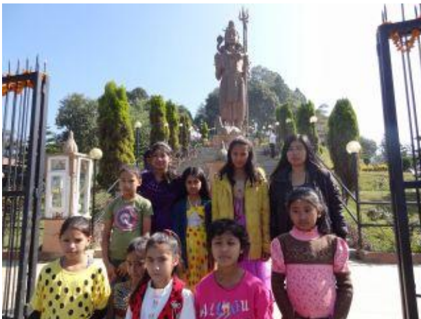
Landets största Shiva-staty i bakgrunden.