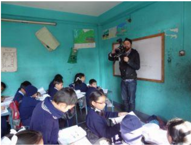
Filmning i klassrummet.