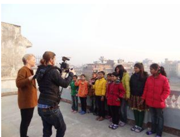
Filmning på terrassen.

Under julhelgen var det ett TV-team från SVT som träffade tjejerna på barnhemmet. De spelade in ett reportage till Lilla Aktuellt, som är ett nyhetsprogram för barn. Det hade gått jättebra och tjejerna var visst överlyckliga över att snart få komma på svensk TV!