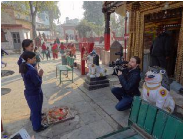
framför ett tempel på väg till skolan.