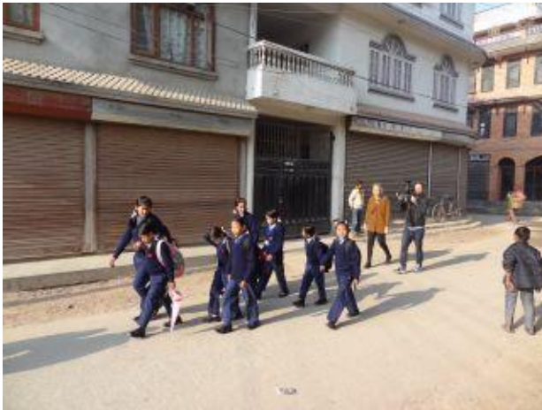
På väg till skolan.