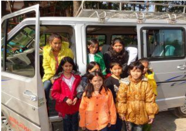
På väg i minibussen