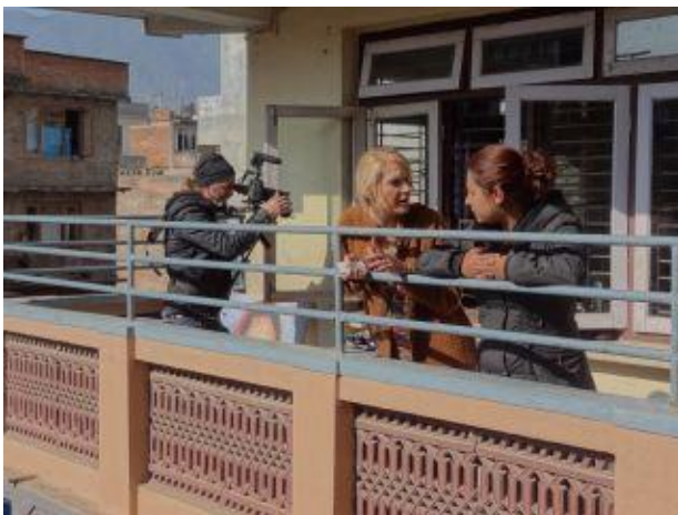
I samtal med skolans biträdande rektor.