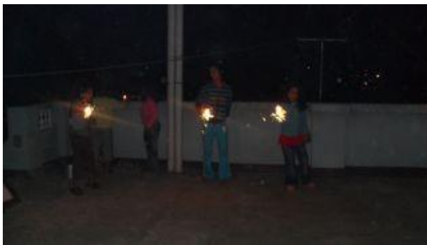
Under Tihar tänder man raketer och tomtebloss.