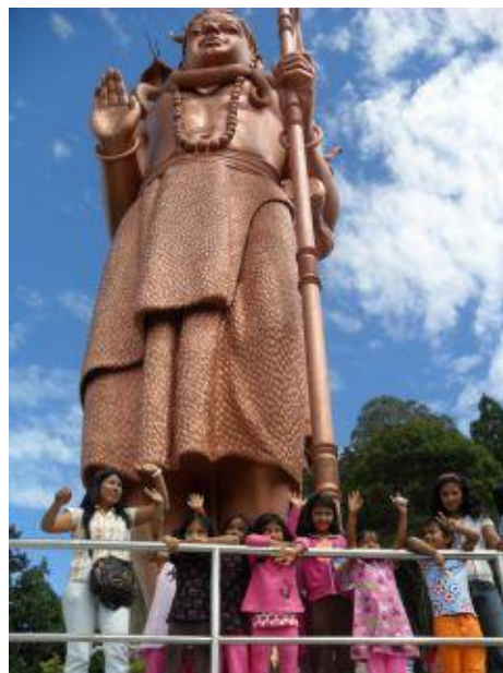
Barnen vis Shiva-statyn