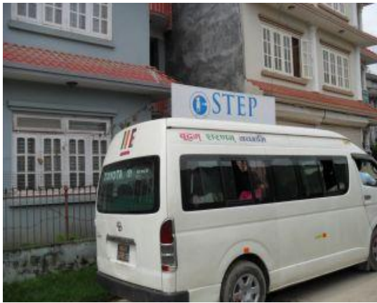
Bussen de åkte med.