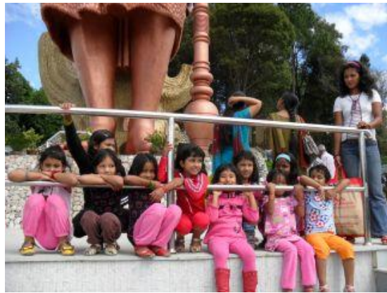
Allihop vid Shivas fötter.