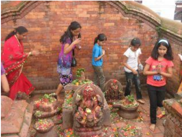
Tjejerna går runt en liten stenstaty av Guden Shiva. Detta tempelområde är nämligen särskilt tillägnat Shiva.