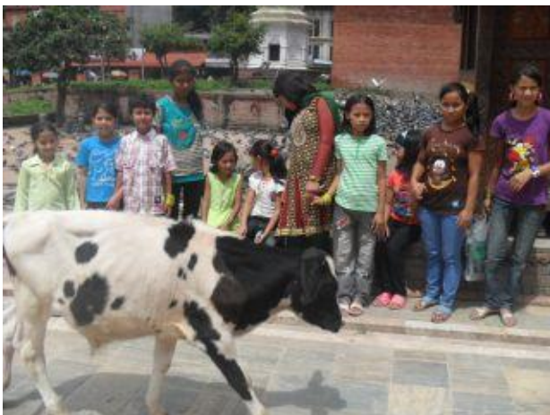
En helig ko passerar tjejerna.