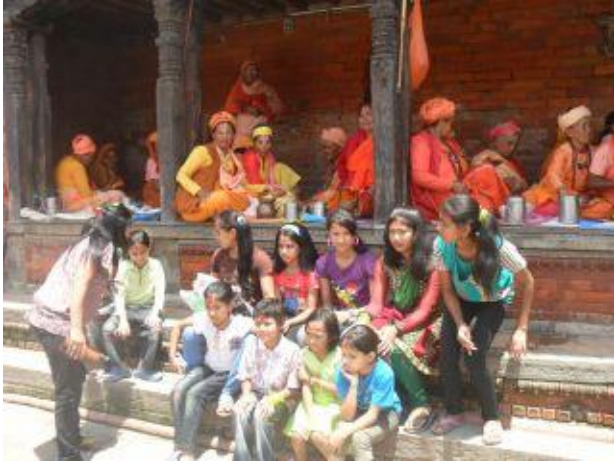
Heliga män i bakgrunden.